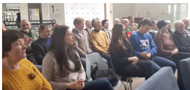
Susitikimas su profesoriumi Liudu Mažyliu nesutruokė gausaus anykštėnų būrio.

L. Mažylis ne tik domisi Lietuvos istorija, bet ir kolekcionuoja su Lietuvos valstybingumu susijusius eksponatus. Jo kolekcijoje – ir 1918 m. vasario m. Vienoje išleistas laikraštis, kuriame išspausdintas Lietuvos nepriklausomybės aktas. „Galima sakyti, tą laikraštį radau visai atsitiktinai. Nuvažiavau į Vieną, į austrų – lietuvių draugijos organizuotą renginį. Po oficialiosios dalies renginio organizatoriai manęs paklausė, kaip noriu praleisti laisvą laiką. Pasakiau, jog nieko nenoriu, nes kitą dieną jau turiu skristi į Vilnių. Tačiau, geriau pagalvojęs, prasitariau, jog norėčiau užsukti į antikvariatą... Žinau tokių pavyzdžių, kai žmogui gimimo dienos proga dovanoja jo gimimo dieną išėjusį laikraštį, o Austrijoje tokia praktika labai dažna. Kai antikvariato savininkas paklausė, ko aš ieškau, atsakiau, jog 1918