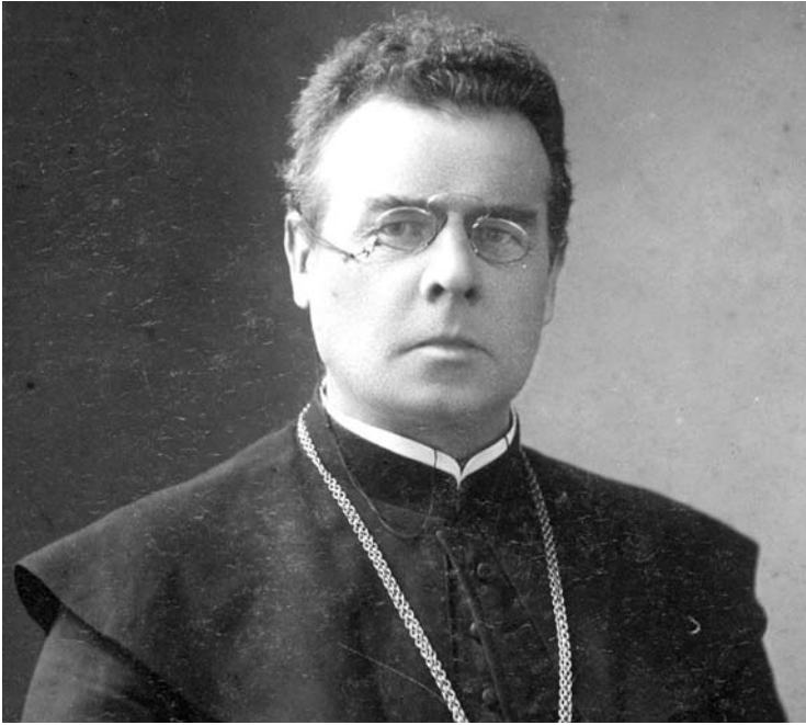
Pirmojo Pasaulinio karo metu Jonas Mačiulis - Maironis Vašuokėnuose vadovavo iš Kauno iškeltai kunigų seminarijai.