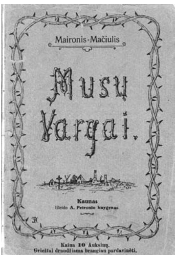
Vašuokėnuose gimė Maironio poema „Mūsų vargai“.

Kauniškių visai nenustebino kaimo žmonių reakcija ir iš nuostabos išplėtos akys. Juk gūdžiais sovietmečio metais apie lietuvių literatūros klasiką Maironį ir jo kūrybą buvo kalbama tik „puse lūpų“. Jo eilėraščiai, poemos alsavo giliu patriotiškumu, meile laisvai ir nepriklausomai Tėvynei Lietuvai, nostalgija garbingai tautos praeičiai, o tuometinėje socialistinėje santvarkoje tokios meilės ir pagarbos gimtinei negalėjo būti. Be to, Maironis buvo kunigas, Kauno kunigų seminarijos rektorius