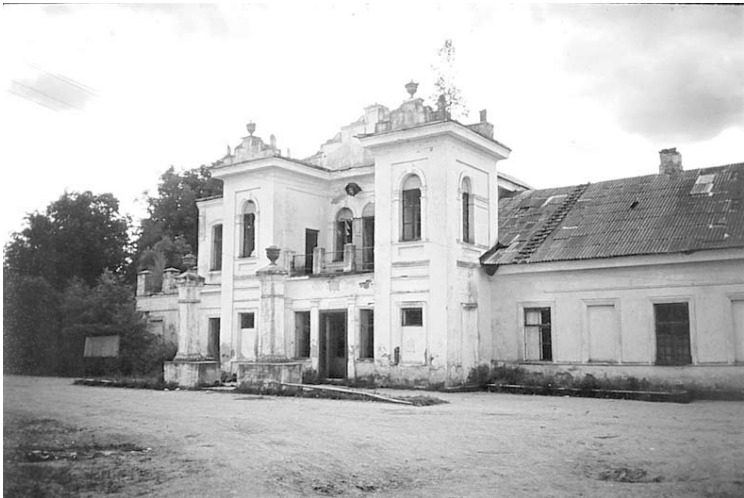
Toks Vašuokėnų dvaras apie 1990 m., kai jis Lietuvos Nepriklausomybę pasitiko...