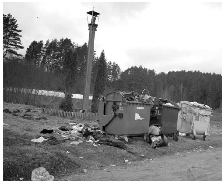
Šiukšlės ir tikėjimo ženklai. Kas ką įveiks?

Kaimų šiukšlių konteineriai nuolat būdavo perpildyti, kai jie stovėdavo ankstenėje vietoje, ant kalniuko, nes šiose apylinkėse nemažai vietos gyventojų ir poilsiautojų. Aplinkui nuolat būdavo pridėta šiukšlių maišų, juos draskydavo maisto atliekų