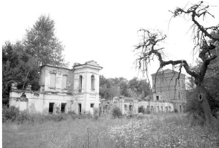
...o taip liūdnai atrodė šie rūmai praėjus dviem dešimtmečiams, kasmet vis labiau laiko ardomi ir griaujami.