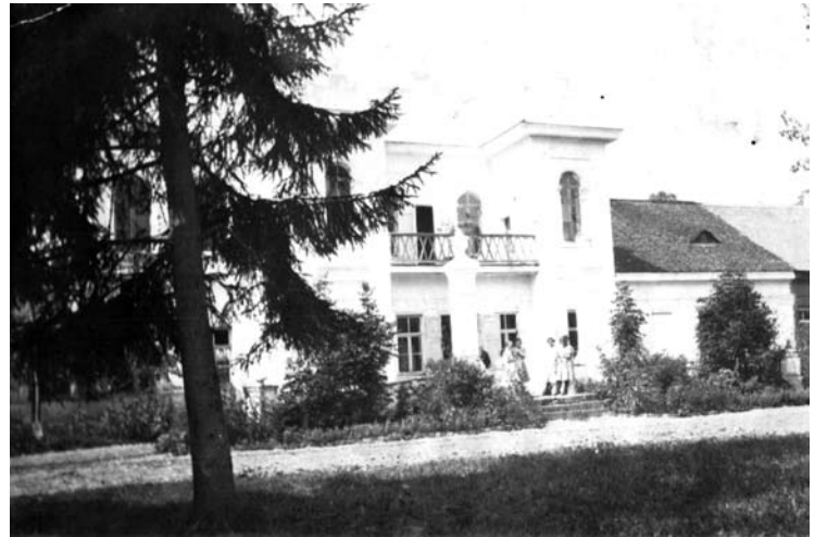
Vašuokėnų Brazdžių dvaras XX a. pradžioje.

Nelengva buvo seminarijos vadovybei surankioti visus savo auklėtinius ir pranešti, kur jie turi atvykti tęsti studijų. Dar sunkiau buvo seminaristams Vašuokėnus pasiekti. Karas šėlo pilnu tempu, į traukinius