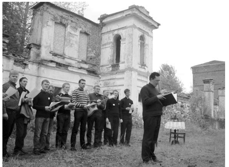
2012-ųjų pavasarį Vašuokėnus aplankė ir tikrai dvaro griuvėsius pamatė Kauno kunigų seminarijos bendruomenė.